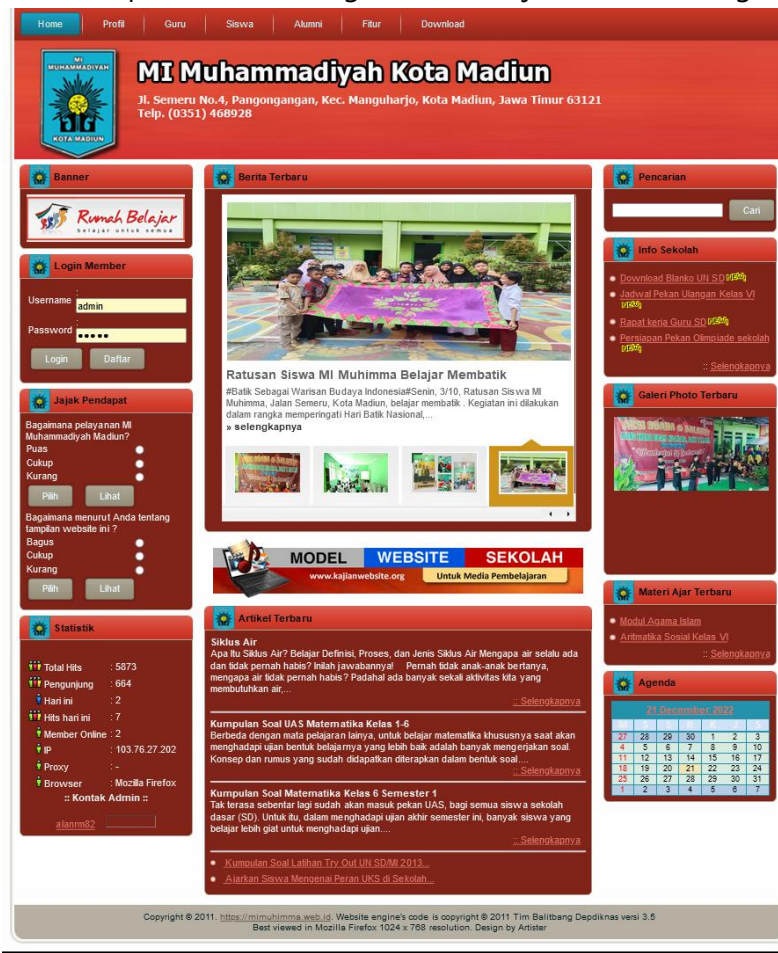
Gambar 3. Tampilan Website Sekolah

Berikut tampilan dari penerapan website MI Muhammadiyah Kota Madiun yang dimanfaatkan sebagai web profil sekolah sekaligus digunakan untuk menunjang pengelolaan beragam data akademik, seperti data siswa, guru, materi ajar dan lain sebagainya.