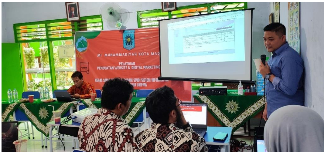
Gambar 6. Pelatihan Pengelolaan Website Sekolah Sesi Tanya Jawab (Bagian 3)