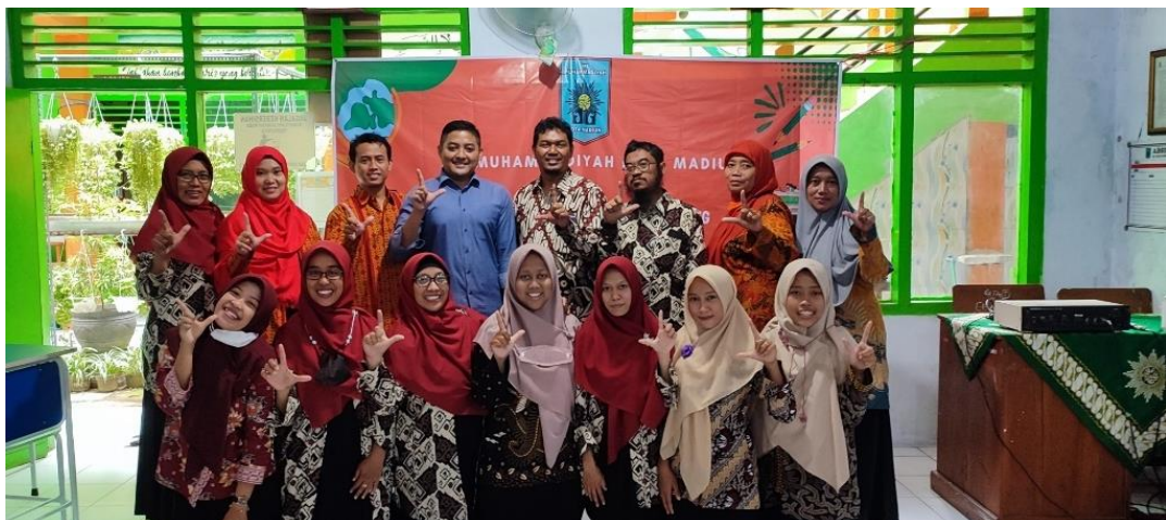
Gambar 6. Pelatihan Pengelolaan Website Sekolah (Bagian 4)