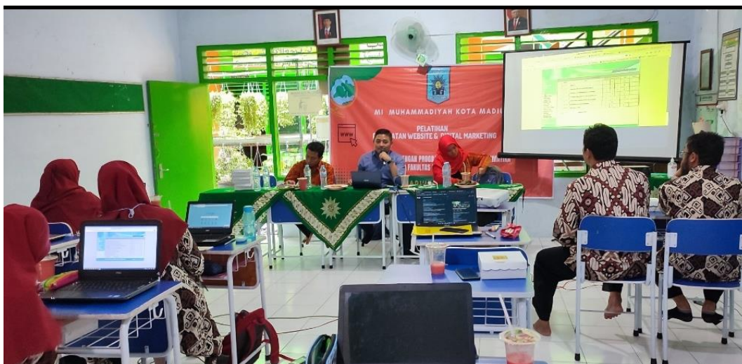
Gambar 4. Pelatihan Pengelolaan Website Sekolah (Bagian 1)

Berikut dokumentasi pelatihan pengelolaan web profil sekolah yang diikuti oleh bapak/ibu guru beserta tenaga kependidikan MI Muhammadiyah Kota Madiun.