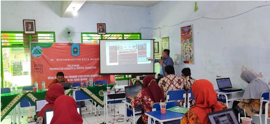
Gambar 5. Pelatihan Pengelolaan Website Sekolah (Bagian 2)