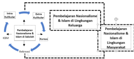
Gambar 8. Model Penguatan Nasionalisme dan Islam Di Lembaga Pendidikan

Penguatan nasionalisme dan Islam di lembaga-lembaga pendidikan pada hakikatnya membutuhkan konsep dan strategi yang baik. Tujuannya, agar semua program dapat terlaksana dengan baik, berhasil dan menimbulkan efek positif bagi warga sekolah (peserta didik, guru, pegawai sekolah, dan karyawan). Model penguatan nasionalisme dan Islam di lembaga pendidikan formal (dunia persekolahan) dapat dilakukan sebagaimana gambar 8 berikut ini.