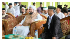
Gambar 6. Pengasuh Pondok Kikil Arjosari Menerima Para Tokoh Agama

Kedua, penguatan proses nasionalisme dan Islam di pondok pesantren. Proses penguatannya berupa pembumih nilai-nilai toleransi ( at-tasammuh ), kesahajan, keramahan dan keteraturan dalam hidup. Tradisi toleransi mengakar begitu kokoh. Bangunan toleransi ( at-tasammuh ), kesehajaan dan keramahan pesantren dibudayakan melalui sumber-sumber pengajaran di pesantren. Melalui kitab-kitab kuning, yang menyajikan perdebatan antar madzhab menjadikan santri tumbuh kembang menjadi pribadi yang menjunjung tinggi arti perbedaan. Kitab fiqih Kifayatul Ahyar , Fatkhul Wahhab , Fatkhul Muin , al Manjmu' 'ala Syarkhil Madzhab , Kitabul Fiqih 'ala Madzhabil Arba'ah , 'Iinahthalibin misalnya, mengurai pelbagai pandangan ulama mengenai praktek-praktek ubudiyah , syariah dan muammalah .