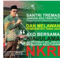
Gambar 4. Pengasuh Pondok Tremas Menyemaikan Nasionalisme

(4) Praktik panca jiwa santri. Pada prinsipnya kehidupan pondok pesantren senantiasa mempraktikkan panca jiwa santri. Panca jiwa santri pada hakikatnya adalah lima prinsip santri, meliputi jiwa keikhlasan; jiwa kesederhanaan; jiwa kemandirian; jiwa uhkuah islamiyyah (persaudaraan); jiwa kebebasan, dan pelaksanaan nilai-nilai torelaransi ( at-tasammuh ), kesahajaan, keramahan, serta keteraturan dalam hidup yang dijalankan penuh makna ( meaning full ) secara alami oleh warga pesantren (Mukodi, 2015a).