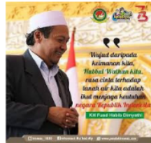
Gambar 3. Pengasuh Pondok Tremas Menyemaikan Nasionalisme

1945 sang kiai atau santri menanamkan jiwa nasionalisme, dan lain sebagainya. Lihat gambar 3 dan 4 berikut ini: