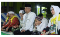
Gambar 5. Pengasuh Pondok Kikil Arjosari Membekali Calon Jama'ah Haji

ini dapat dilihat secara nyata, biasanya pondok pesantren salafi tidak membatasi lingkungan pondok dengan lingkungan sekitar dengan pagar pembatas; (c) cinta kasih sesama. Pondok pesantren dengan beragam ilmu keagamaan dan praktik-praktik kebaikan yang dimilikinya 'tidak pernah' menempatkan diri mereka layaknya menara gading, elit dan eksklusif. Melainkan, ia hadir ditengah-tengah masyarakat sebagai solusi banyak hal, sebut saja solusi persoalan agama, solusi percekocokan rumah tangga, solusi masalah remaja, dan lain sebagainya. Lihat gambar 5 dan 6 berikut ini: