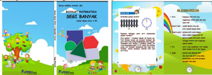
Gambar 2. Produk Akhir Booklet Matematika Materi Segi Banyak

Berdasarkan hasil penilaian oleh pembimbing dan para ahli, diperoleh saran sebagai berikut: (1) desain cover dibuat supaya disesuaikan dengan tema yang akan disampaikan dengan tujuan supaya siswa mengetahui bahwa materi yang disampaikan dalam booklet ini merupakan materi matematika; (2) background dibuat lebih simpel supaya tidak ramai dan menjadikan siswa hilang fokus saat mempelajarinya serta menghindari beberapa tulisan yang sulit terbaca; (3) penambahan halaman untuk petunjuk penggunaan serta contoh soal dengan tujuan siswa dapat dengan mudah mempelajari materi yang disampaikan serta lebih mendalami lagi maksud materi yang disampaikan. Berikut ini visualisasi booklet matematika materi segi banyak untuk meningkatkan hasil belajar siswa.