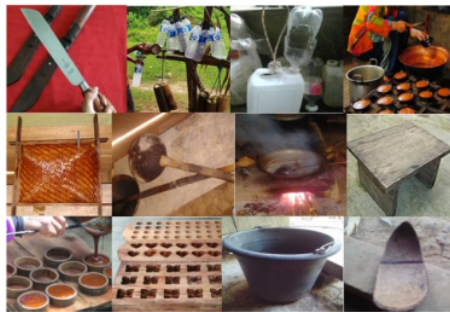
Gambar 1. Alat dan Bahan Produksi Gula Kelapa

1 Etnomatematika pada proses produksi gula kelapa dapat di eksplora berdasarkan identifikasi alat dan bahan serta aktivitas-aktivitas yang ada dalam proses tersebut. Berikut adalah bentuk geometri bangun datar dan bangun ruang peralatan produksi gula kelapa. Diantaranya adalah Pisau/Belati, Eklek , Bumbung , Panci/kuali , Kalo (saringan), Irus, Tungku, Cetakan, Dingklik/tempat duduk, Ember, Kerokan/Sendok, dan lain-lain.