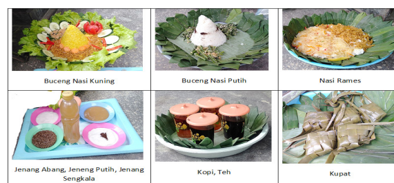
Gambar 2. Perlengkapan Upacara Adat Tetaken

orang tampak membawa bumbung (wadah air dari bambu) berisi legen atau nira (air yang diperoleh dari pohon aren). Saat berada di tempat acara, secara bergilir para pembawa legen menuangkan isi bumbungnya ke dalam sebuah gentong yang diyakini bermanfaat untuk kesehatan. Kemudian setelah semua penunjang ritual berada ditempat acara, acara inti pun segera dimulai. Perlengkapanyang lain berupa hasil bumi masyarakat Mantren yang akan dimakan secara bersama-sama setelah selesai prosesi Tetaken. Wujudnya berupa Tumpeng beserta isinya.