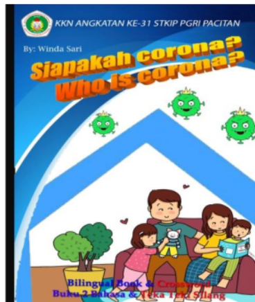
Gambar 1. Buku bilingual sebagai media pembelajaran