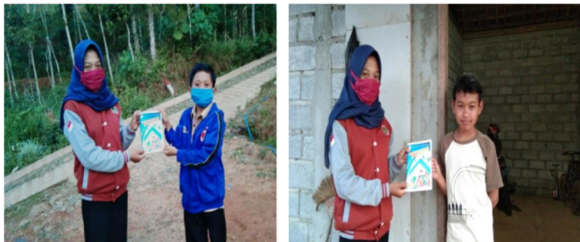
Gambar 2. Pembagian buku kepada anak-anak

Buku yang telah dicetak kemudian dibagikan kepada anak-anak. Setiap anak mendapatkan satu buku.