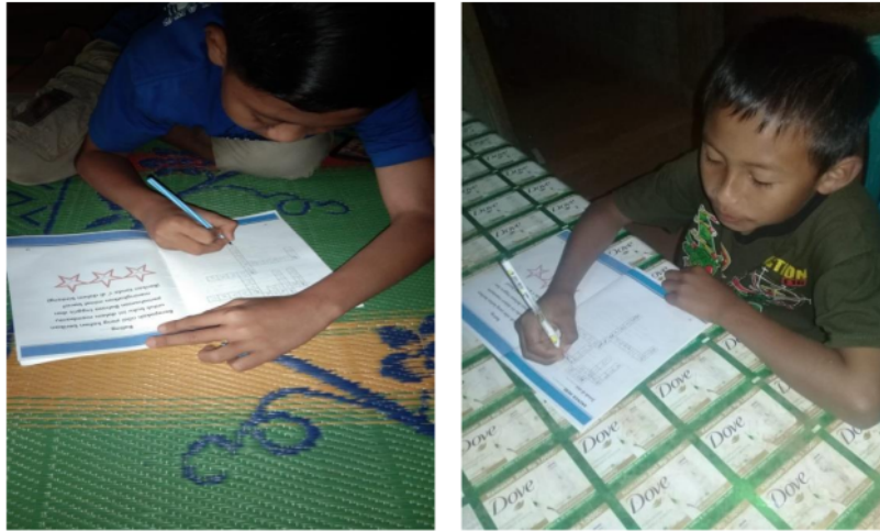
Gambar 3. Proses belajar anak di rumah