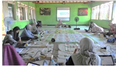
Figure 5: Tahap Pemaparan Materi