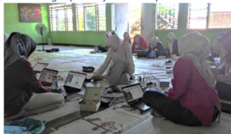
Figure 9: Pendampingan dalam Pembuatan Aplikasi

Selain pemaparan materi dan praktik membuat aplikasi, tim abdimas juga melakukan pendampingan terhadap para peserta kegiatan. Tim abdimas melakukan pendampingan ke setiap peserta. Selain itu, tim abdimas juga mencari penyelesaian atas kendala yang dialami oleh peserta. Kendala yang muncul diantaranya adalah sinyal internet yang tidak stabil, kesulitan dalam menginstal aplikasi iSpring Suite 11 karena tidak semua laptop yang dibawa peserta compatible dengan iSpring Suite 11, kesulitan membuat workflow , dan terbatasnya waktu praktik.