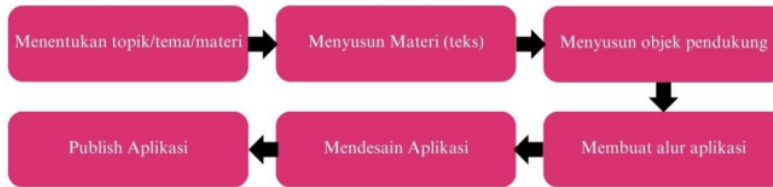
Figure 6: Alur Pembuatan Aplikasi

Pada tahap ini, peserta melakukan langkah-langkah sebagai berikut: