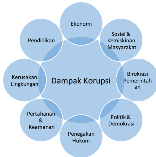
Gambar 2. Dampak Korupsi dalam Pelbagai Sektor

Lebi dari itu, dampak korupsi bagi kehidupan berbangsa dan bernegara begitu nyata. Korupsi akan berdampak terhadap: (1) ekonomi; (2) sosial dan kemiskinan masyarakat; (3) birokrasi pemerintahan; (4) politik dan demokrasi; (5) penegakan hukum; (6) pertahanan dan keamanan; (7) kerusakan lingkungan; (8) dan pendidikan. Lihat gambar 2 berikut ini: