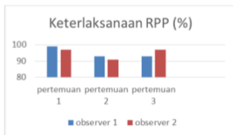
Gambar 3. Keterlaksanaan RPP

Keterlaksanaan pembelajaran dilihat dari seberapa banyak rancangan pembelajaran yang terlaksana. Berikut adalah keterlaksanaan RPP terdapat pada gambar 3