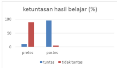
Gambar 2. Ketuntasan Hasil Belajar

Berdasarkan data pretes dan pos tes dapat dilihat ketuntasan hasil belajar siswa dalam gambar 2.