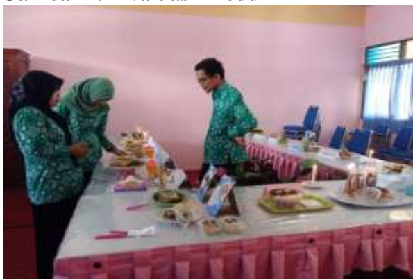
Gambar 1. Evaluasi Produk

Tahapan yang terakhir dalam metode pembelajaran berbasis produksi adalah membuat konsep dan strategi pemasaran. Tahapan ini sangat penting karena dapat membantu mahasiswa dalam proses penjualan produknya. Berbagai macam konsep dan strategi pemasaran yang ada bisa diterapkan mahasiswa supaya produk yang dibuatnya terjual dan diminati konsumen. Lewat media sosial cara yang banyak diminati mahasiswa untuk mengenalkan dan memasarkan produknya. Cara ini cukup efektif dan tidak