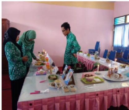
Gambar 1 Evaluasi Produk

terdiri dari beberapa dosen dan karyawan yang ada di kampus. Hasil produk mahasiswa berupa makanan dan minuman maka evaluasinya berkaitan dengan rasa, bentuk atau tampilan dan inovasi produk. Selain evaluasi produk yang tidak kalah penting yaitu evaluasi kemasan. Pengemasan produk sangat penting karena merupakan salah satu cara untuk menarik konsumen supaya mau membelinya. Kemasan juga harus disesuaikan dengan produknya. Untuk produk makanan dan minuman tingkat keamanan dan kebersihan dalam kemasan menjadi faktor utama. Hasil dari evaluasi produk akan disampaikan kepada mahasiswa untuk dapat dijadikan bahan pertimbangan dalam proses pembuatan produk selanjutnya.