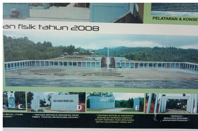
Gambar 1.1 Wujud wisik Monumen Jenderal Soedirman

Baguna Monumen Jendral Soedirman juga mempunyai Nilai-nilai Simbolik diantaranya yaitu :