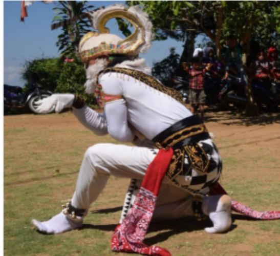
Gambar 34. Gerakan Jengkeng dan membukuk dikombinasi tangan di depan dada (Dokumentasi Pribadi)