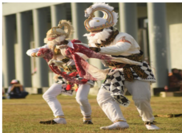
Gambar 23. Bercanda, Bermain Dan Bercengkerama Baik Dengan Penonton Meskipun Dengan Sesama Penari