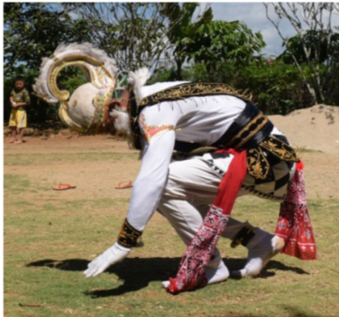
Gambar 45. Gerakan awal roll memutar tubuh 360°

Gerak ini mengisyaratkan akan melakukan gerak Rol depan yang sudah dijelaskan di deskripsi di atas. Gerakan berputar seluruh tubuh 360 derajat ke depan. Dan di akhir posisi jengkeng pose kera.