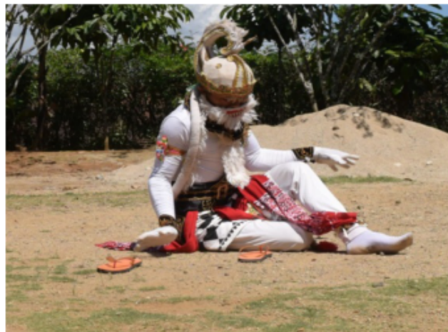
Gambar 67. Jengkeng dengan pantat sebagai tumpuan

Gambar 67 di atas sebuah gerakan Kethek Ogleng dengan posisi kaki jengkeng kiri akan tetapi pantat menempel ditanah. Dalam gerak ini kethek ogleng sedang mengeksplor sesuatu