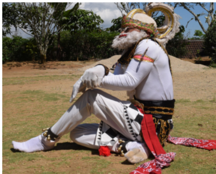
Gambar 19. Gerakan Duduk Mengamati Lingkungan Sekitar (Dokumentasi Pribadi)