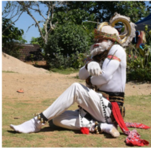
Gambar 52. Gerakan hampir sama gerakan kedua puluh delapan

Posisi kaki jengkeng kiri akan tetapi pantat menempel di tanah. kedua tangan di depan dada yang tangan kiri posisi menempel di dada bagian kanan dengan bentuk jari membuka telapak tangan menghadap ke dada dengan gerak menggaruk-garuk dada, kemudian yang tangan kanan di atas tangan kiri bentuk jari mencakar telapak tangan menghadap ke bawah. Posisi badan tegak lurus "Ndegek" dalam istilah tari Jawa dan posisi kepala melihat lurus ke depan.