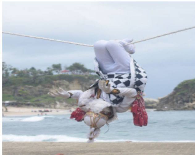
Gambar 62. Gerakan Ngalong (Dokumentasi Pribadi)

Gerak ini merupakan salah satu gerak akrobatik yang sering disebut “Ngalong” yaitu sebuah istilah tari Jawa seperti kelelawar yang menggantung di dinding-dinding atas suatu tempat akan tetapi media yang digunakan untuk posisi ini yaitu media tali yang dibentangkan dari titik satu ke titik yang lain sesuai dengan ketinggian dan panjang yang diinginkan. Dalam gerak ini penari kethek ogleng dapat mengeksplorasi gerak-gerak seperti menggaruk-garuk, pose memandang dan lain sebagainya.