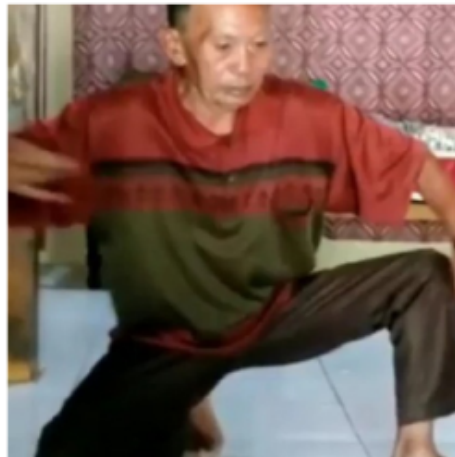
Gambar 15. Gerakan Kelima Belas Blendrong dalam Kethek Ogleng

Posisi kaki berjongkok dengan kaki kiri di depn sedangkan kaki kanan dengan lutut diantai dan telapak kaki kanan bertumpu pada lantai. Sedangkan tangan kiri menempel di lutut kaki kiri sedangkan tangan kanan di atas dada dengan kepalan tangan ringan.