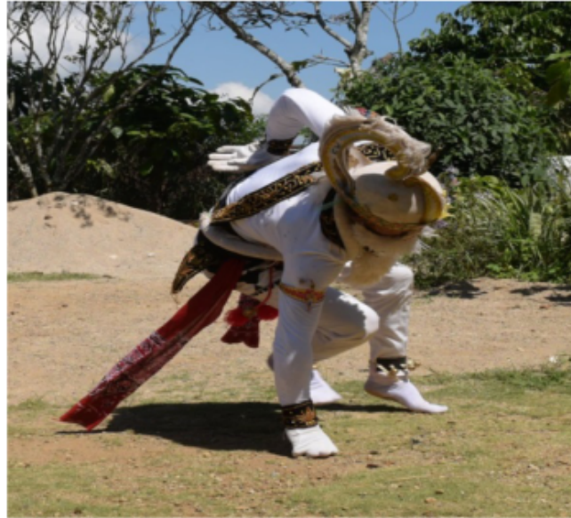
Gambar 42. Gerakan membukuk dan berjalan dengan kepala melihat lurus ke depan