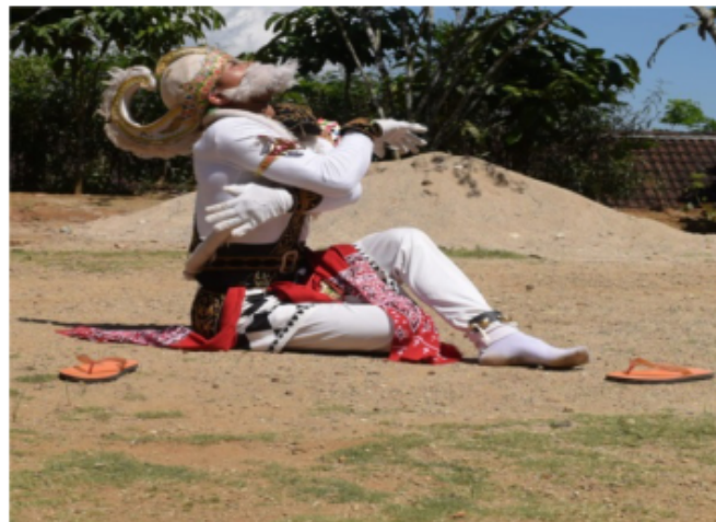
Gambar 68. Gerakan repetisi Jengkeng dan Ndegek (Dokumentasi Pribadi)

Posisi kaki jengkeng kiri akan tetapi pantat menempel di tanah kedua tangan melekat di depan dada yang kanan posisi di atas dengan bentuk jari membuka telapak tangan menghadap ke bawah, kemudian yang kiri di bawah tangan kanan menempel di dada kiri dengan bentuk jari seperti menggaruk. Posisi badan tegak lurus “Ndegek” dalam istilah tari Jawa dan posisi kepala mendongak ke atas seperti melihat sesuatu yang jauh.