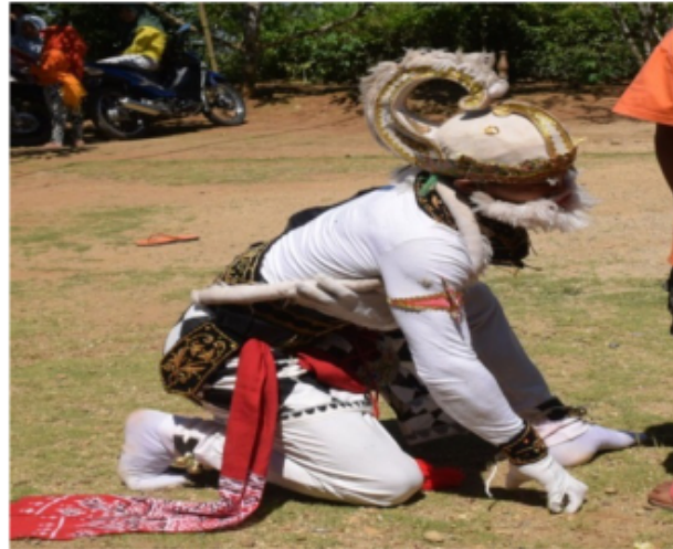
Gambar 73. Gerakan Jengkeng dan tangan menyentuh tangan

Posisi ini merupakan berakhirnya gerak jalan kera berdiri yang sudah dijelaskan di atas. Yaitu posisi kaki jengkeng kiri salah satu tangan menyentuh tangan dan posisi kepala mengikuti motivasi yang dituju atau di lihat atau dicapai dapat dilihat dalam gambar di bawah ini .