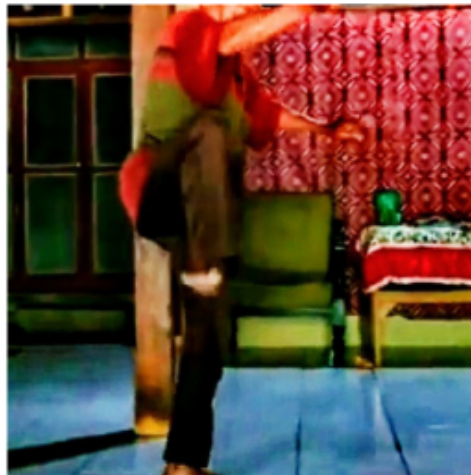
Gambar 14. Gerakan Keempat Belas Blendrong dalam Kethek Ogleng

Lanjutan dari gerakan tadi dengan posisi bergantian, posisi berjalan ke arah depan dengan kaki kanan diangkat dengan kaki kiri sebagai tumpuannya. Sedangkan tangan kanan berada di belakang dan kiri di depan dengan kedua telapak tangan mengepal ringan.