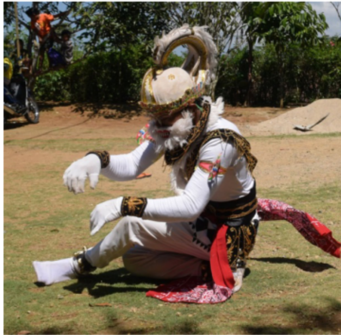
Gambar 40. Gerakan Jengkeng dan cekitingan