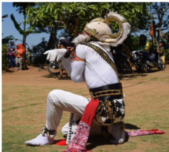
Gambar 35. Gerakan Jengkeng dengan kombinasi tangan menyilang menyerupai Ketek menggaruk