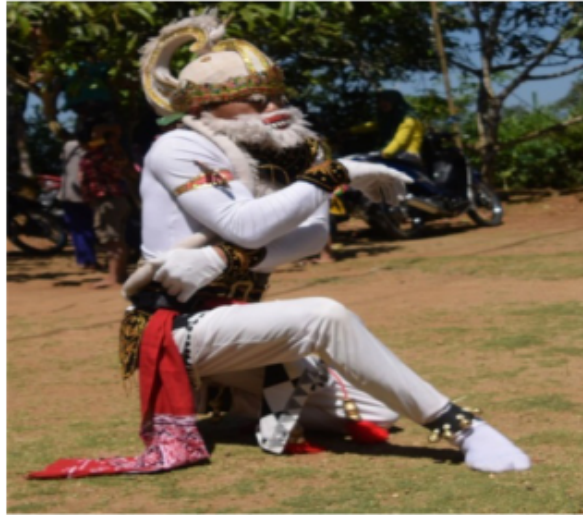
Gambar 26. Gerakan Jengkeng dan Ndegek