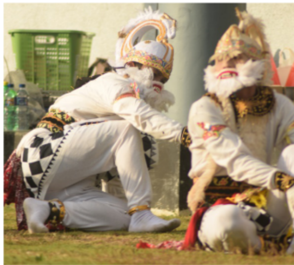
Gambar 20. Interaksi dengan Lingkungan Sekitar