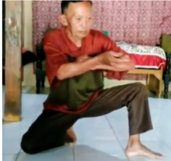
Gambar 3. Gerakan Ketiga Blendrong dalam Ketehk Ogleng