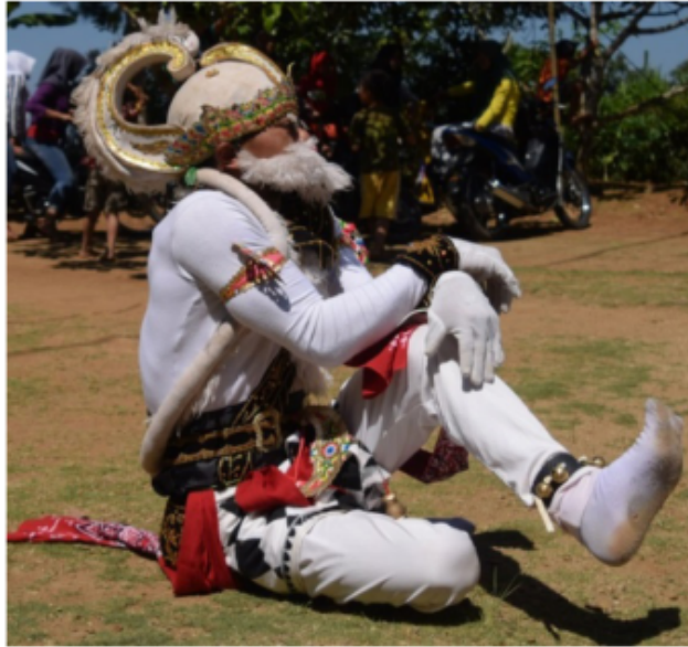
Gambar 29. Gerakan jengkeng dan Ndekek dikombinasi dengan tangan menyilang di atas paha