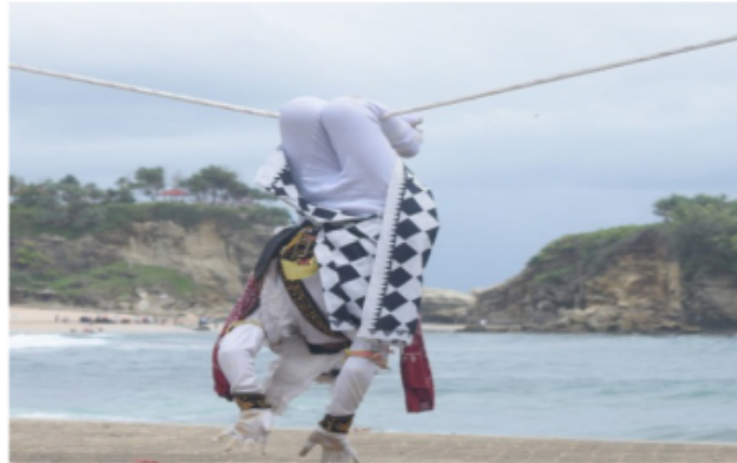
Gambar 63. Gerakan variasi Ngalong

Berdasarkan gambar 63, gerak ini merupakan salah satu gerak akrobatik yang sering disebut “Ngalong” yaitu sebuah istilah tari Jawa seperti kelelawar yang menggantung di dinding-dinding atas suatu tempat akan tetapi media yang digunakan untuk posisi ini yaitu media tali yang dibentangkan dari titik satu ke titik yang lain sesuai dengan ketinggian dan panjang yang diinginkan. Dalam gerak ini penari kethek ogleng dapat mengeksplorasi gerak-gerak seperti menggaruk-garuk, pose memandang dan lain sebagainya.