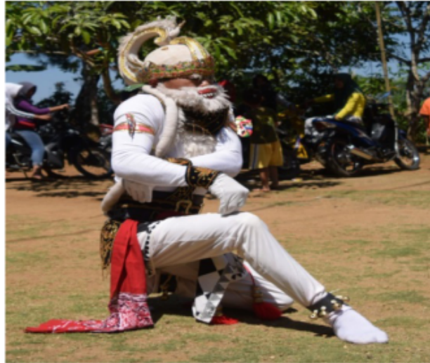
Gambar 28. Gerakan jengkeng dan Ndegek dikombinasi dengan tangan menghadap paha