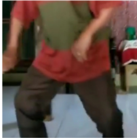
Gambar 12. Gerakan Kedua Belas Blendrong dalam Kethek Ogleng

Posisi kaki kuda-kuda agak membungkuk dengan kedua tangan di depan perut dengan posisi menggenggam ringan. Hal ini untuk memulai gerakan berikutnya sebagai awalan dalam gerakan selanjutnya.