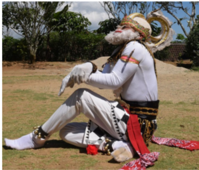
Gambar 48. Gerakan Jengkeng dan mendongak (Dokumentasi Pribadi)

Posisi kaki jengkeng kiri akan tetapi pantat menempel di tanah kedua tangan di depan dada menempel lutut kiri dengan bentuk menyilang yang tangan kanan posisi di atas tangan kiri di bawah dengan bentuk jari mencakar dan telapak tangan menghadap ke lutut. Posisi badan agak membungkuk dan posisi kepala melihat lurus ke depan sedikit mendongak ke atas. Seperti dalam gambar 46 di bawah ini.