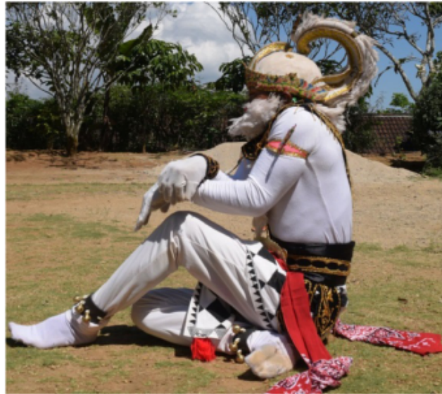
Gambar 49. Gerakan jengkeng dikombinasi dengan kepala mendongak

Gambar 49 di atas, posisi kaki jengkeng kiri akan tetapi pantat menempel di tanah kedua tangan di depan dada menempel lutut kiri dengan bentuk menyilang yang tangan kanan posisi di atas tangan kiri di bawah dengan bentuk jari mencakar dan telapak tangan menghadap ke lutut. Posisi badan agak membungkuk dan posisi kepala melihat lurus ke depan sedikit mendongak ke atas