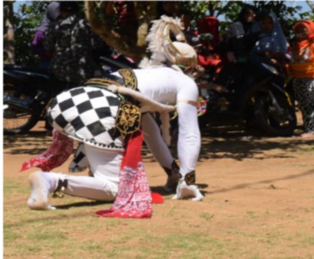
Gambar 66. Gerakan roll (Dokumentasi Pribadi)