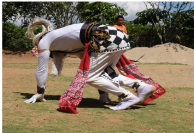
Gambar 60. Gerakan persiapan roll depan

Gambar 60. Seni Kethek Ogleng dengan gerakan mengisyaratkan akan melakukan gerak roll depan yang sudah dijelaskan