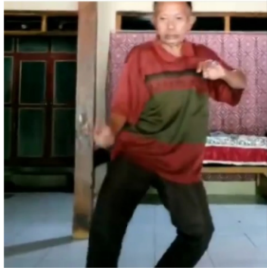
Gambar 11. Gerakan Kesebelas Kethek Ogleng Blendrong dalam Kethek Ogleng