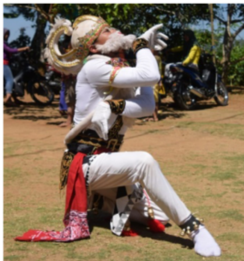
Gambar 27. Gerakan Jengkeng dan Ndegek disertai jari jimpitan