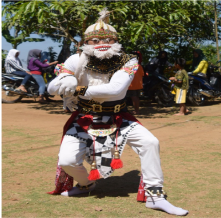
Gambar 24. Gerakan nyekithing