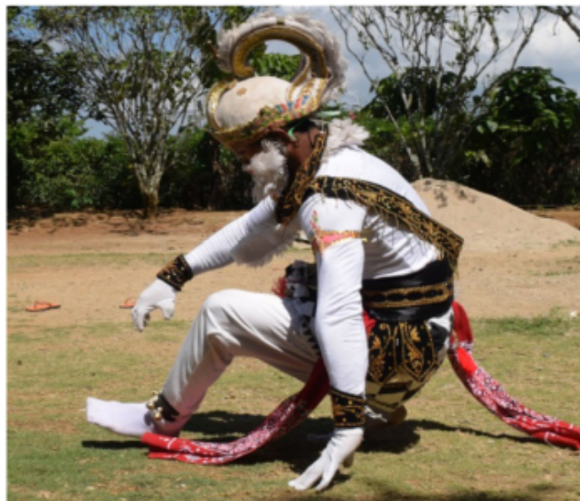
Gambar 44. Gerakan lanjutan jalan ke samping dikombinasikan dengan melontarkan tubuh