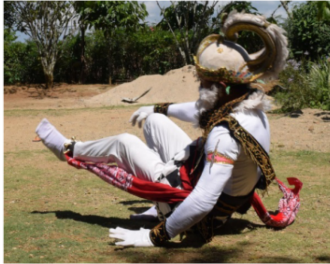
Gambar 43. Gerakan berjalan dengan pantat sebagai tumpuan (Dokumentasi Pribadi)