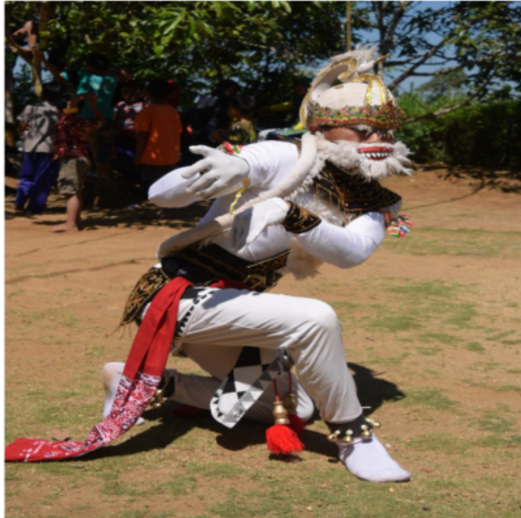
Gambar 25. Gerakan trecetan (Dokumentasi Pribadi)