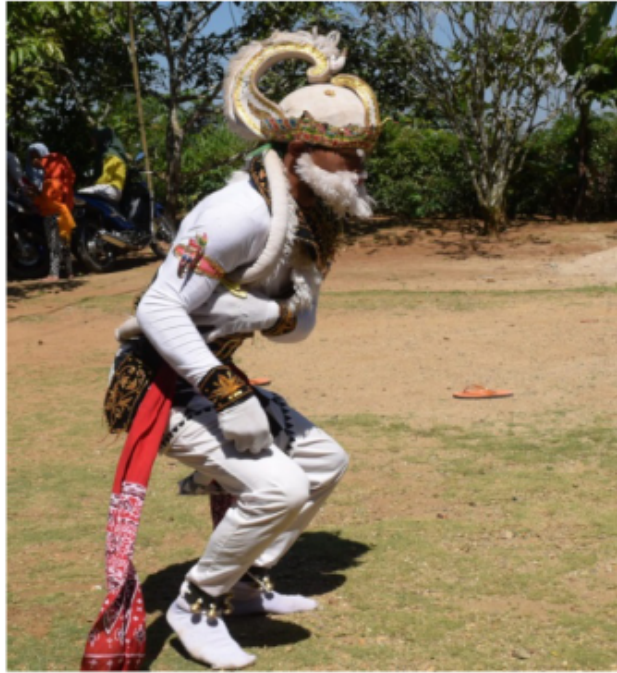
Gambar 71. Gerakan eksploratif berupa garuk-garuk khas kera

Gerak ini merupakan sebuah gerak eksplorasi menggaruk-garuk badan dengan posisi berdiri sama seperti penjelasan di atas yaitu gerak imitatif yang menirukan kebiasaan kera pada umumnya.