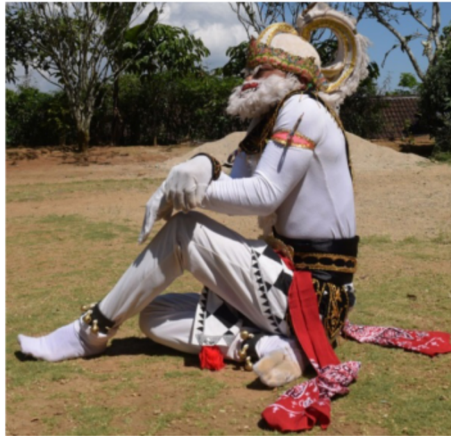
Gambar 46. Gerakan Jengkeng dan membungkuk dikombinasi tangan menilang di dada

Berdasarkan gambar 46 di atas, posisi kaki jengkeng kiri akan tetapi pantat menempel di tanah kedua tangan di depan dada menempel lutut kiri dengan bentuk menyilang yang tangan kanan posisi di atas tangan kiri di bawah dengan bentuk jari mencakar dan telapak tangan menghadap ke lutut. Posisi badan agak membungkuk dan posisi kepala melihat lurus ke depan sedikit mendongak ke atas