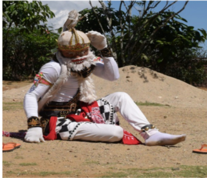
Gambar 69. Gerakan Jengkeng dan Ndegek sembari menggaruk

Posisi kaki jengkeng kiri akan tetapi pantat menempel di tanah. Dalam gerak ini kethek ogleng sedang menggaruk garuk kepala atau bagian tubuhnya bisa badan tangan kepala ataupun kaki. Gerak ini merupakan gerakan imitatif dari sebuah penglihatan seekor kera seperti pada umumnya.