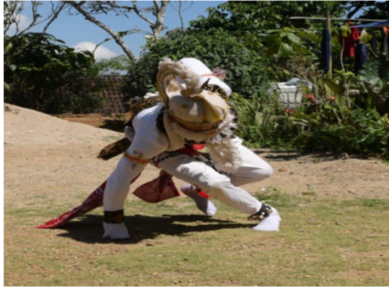
Gambar 57. Gerakan berjalan nyemper seperti kera berlari