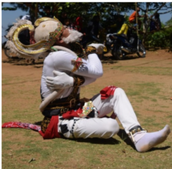
Gambar 30. Gerakan Jengkeng dan Ndegek dengan kombinasi tangan melekat di dada (Dokumentasi Pribadi)