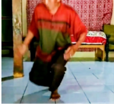
Gambar 5. Gerakan Kelima Blendrong dalam Kethek Ogleng

Gerakan kaki jengkeng dengan telapak kaki jinjit dengan posisi badan setengah membungkuk dengan posisi kepala menunduk melihat ke bawah dengan kedua tangan menggenggam ringan.