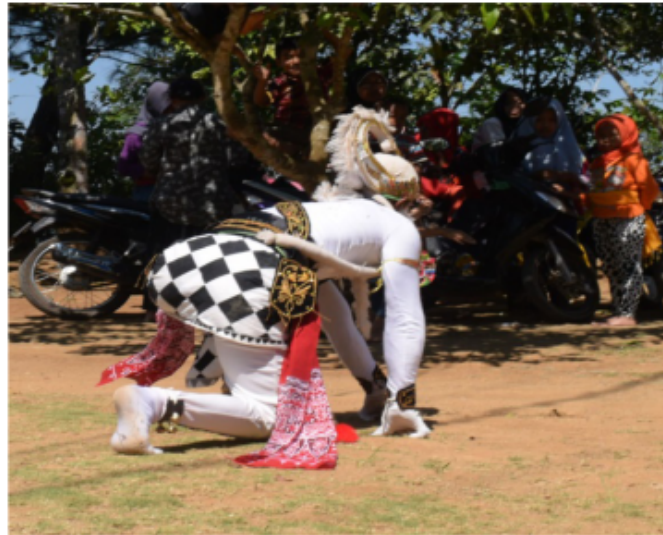
Gambar 61. Gerakan Jengkeng seperti hendak lari

Gerak ini merupakan posisi akhir dari gerak Rol depan di atas yaitu posisi jengkeng kiri seperti seorang atlet lari yang mau bersiap untuk berlari.