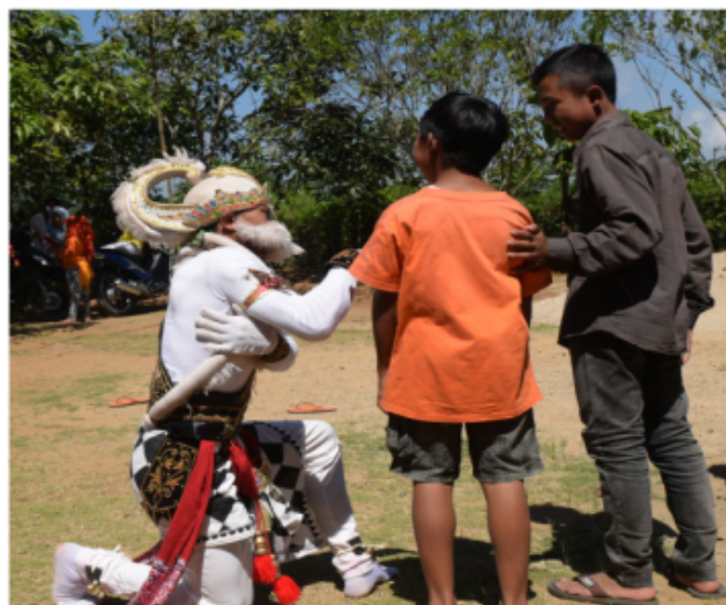
Gambar 21. Gerakan usil kepada penonton