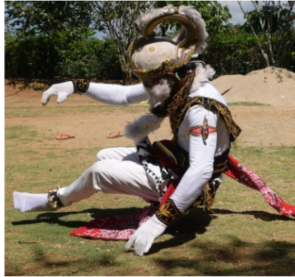
Gambar 39. Gerakan Mendarat setelah berputar 360° (Dokumentasi Pribadi)