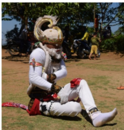
Gambar 31. Gerakan Jengkeng kiri dan Ndegek dikombinasi dengan jari menggenggam (Dokumentasi Pribadi)