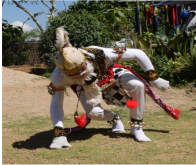
Gambar 58. Gerakan berjalan nyemper dengan tumpuan tangan kanan untuk melontarkan badan dan kaki