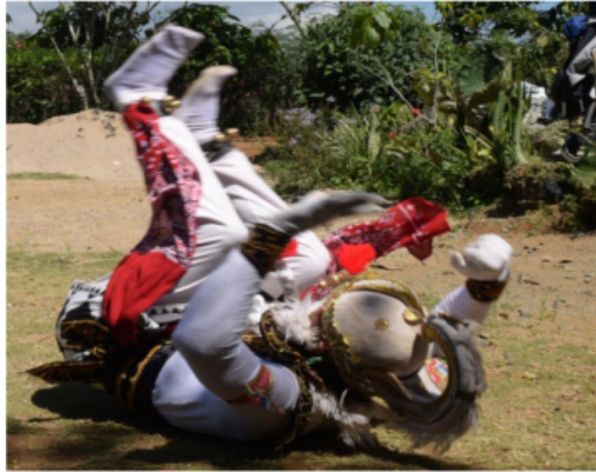
Gambar 38. Gerakan lanjutan roll depan dengan punggung sebagai tumpuan