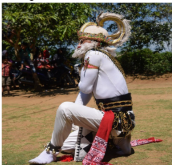
Gambar 36. Gerakan ndegek dan kepala tegak