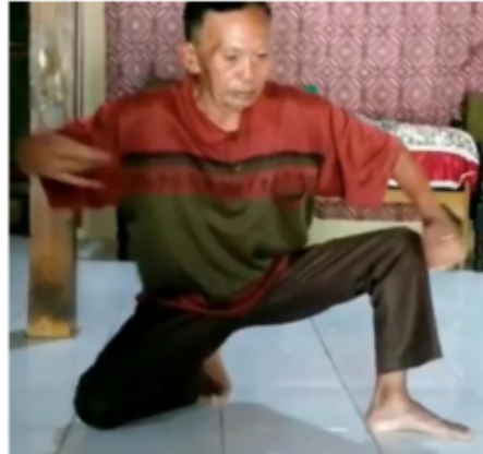
Gambar 16. Gerakan Penutup Blendrong dalam Kethek Ogleng