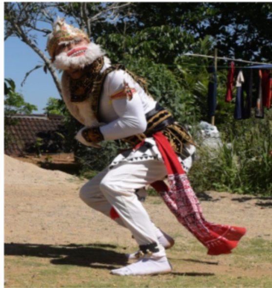
Gambar 77. Gerakan meloncat dan menggaruk ala Kera (Dokumentasi Pribadi)

Gerakan imitatif kera dengan teknik kaki meloncat ke kanan ke kiri dengan posisi tubuh berdiri. Posisi tangan bisa mengeksplorasi gerak menggaruk atau sedang memandang atau mencakar dan lain sebagainya. Posisi kepala sesuai yang diinginkan penari kethek ogleng.