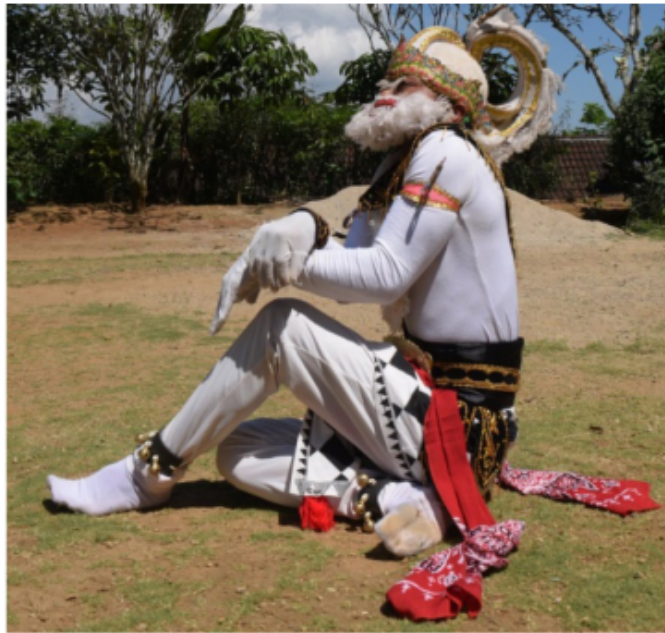
Gambar 47. Gerakan Jengkeng dan membungkuk dengan kepala mendongak serta siap menyakar

Posisi kaki jengkeng kanan akan tetapi pantat menempel di tanah kedua tangan di depan dada menempel lutut kiri dengan bentuk menyilang yang tangan kiri posisi di atas tangan kanan di bawah dengan bentuk jari mencakar dan telapak tangan menghadap ke lutut. Posisi badan agak membungkuk dan posisi kepala melihat lurus ke depan sedikit mendongak ke atas. Seperti yang tergambar pada gambar 47 di bawah ini.