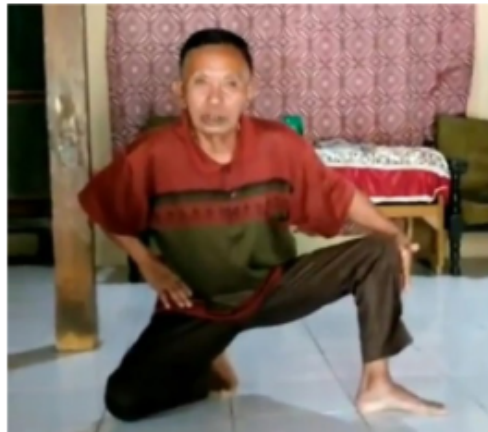
Gambar 4. Gerakan Keempat Blendrong dalam Ketehk Ogleng

Posisi duduk jengkeng dengan kaki kiri di depan kaki kanan dengan lutut bertumpu di tanah dengan telapak jari kanan bertumpu pada lantai. Tangan kiri berada di utut kiri sedangkan tangan kanan bertumpu pada pinggang kanan. Kepala dengan pandangan mengarah ke depan.