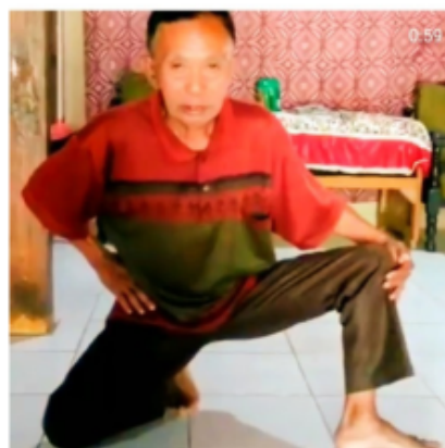
Gambar 17. Penutup Blendrong dalam Kethek Ogleng

Posisi tangan kiri memegang lutut kaki kiri dengan posisi berjongkok dengan tumpuan kaki kanan. Tangan kanan memegang pinggang sebelah kanan dengan kepala lurus ke depan disertai dengan sorotan mata ke depan sebagai isyarat akan berakhirnya bendrong.