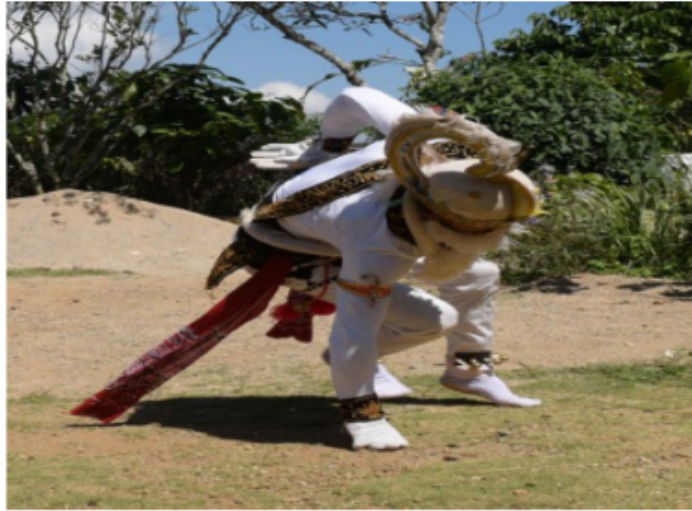
Gambar 57. Gerakan lanjutan gerak sebelumnya dengan jari menyakar

Gerak jalan kera ke samping kanan dengan lontaran kedua kaki ke kiri kemudian menggunakan tumpuan tangan kanan yang menggenggam ke tanah dan tangan kiri diteuk dengan bentuk jari mencakar di sebelah kiri badan bagian kiri belakang. Badan posisi membungkuk dan posisi kepala melihat lurus ke samping kiri depan.