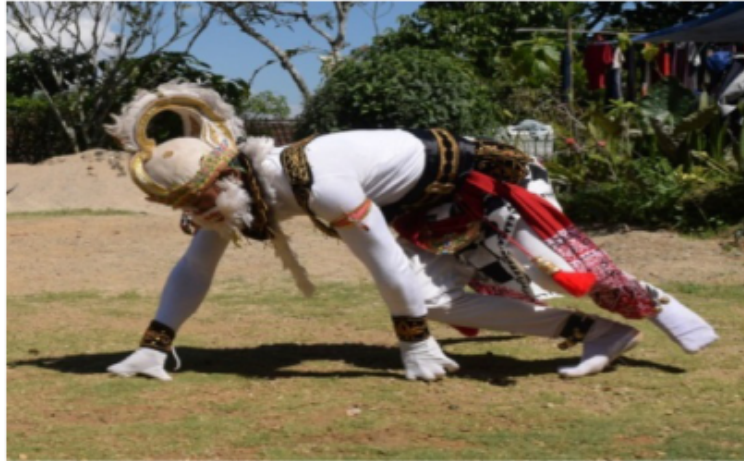
Gambar 59. Gerakan merangkak dan membungkuk ala kera