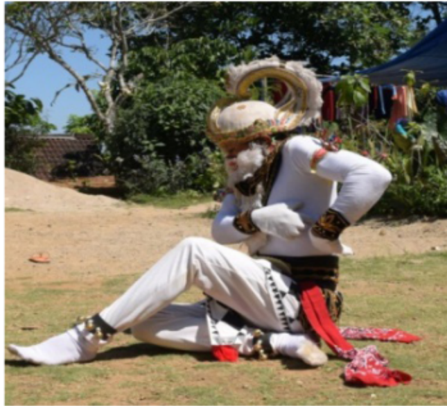
Gambar 55. Gerakan berjalan dengan Ngesot dan melontarkan tubuh serta tangan menggenggam tanah

Gambar 55 di atas, gerak jalan kera ke samping kiri dengan lontaran kedua kaki ke kanan kemudian menggunakan tumpuan tangan kiri yang menggenggam ke tanah dan tangan kanan ditekuk dengan bentuk jari mencakar di sebelah kanan badan bagian kanan belakang. Badan posisi membungkuk dan posisi kepala melihat lurus ke samping kiri depan.