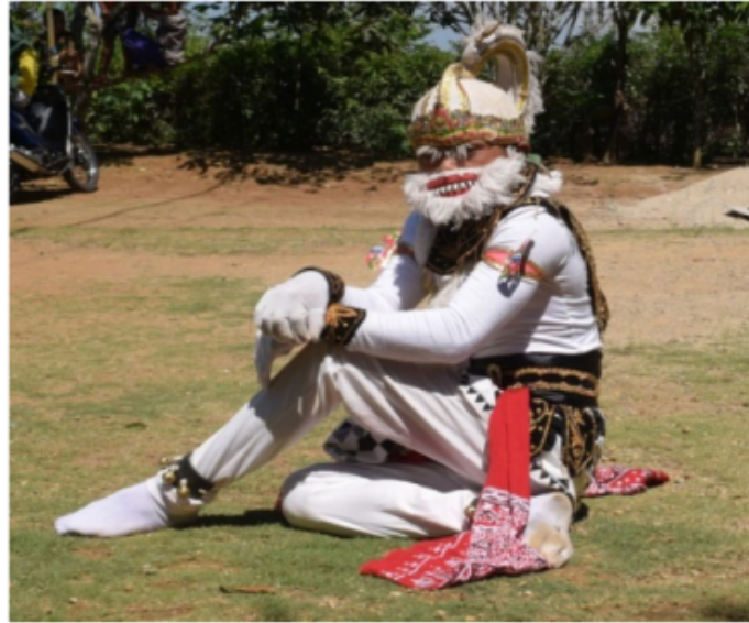
Gambar 41. Gerakan jengkeng dan jari siap menyakar