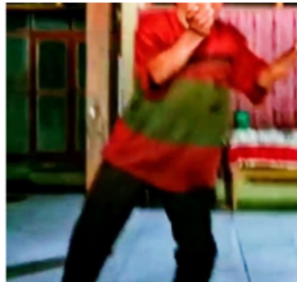
Gambar 8. Gerakan Kedelapan Blendrong dalam Kethek Ogleng