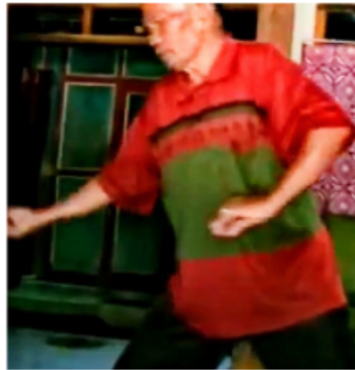
Gambar 7. Gerakan Ketujuh Blendrong dalam Kethek Ogleng

Gerakan berjalan dengan kaki kanan di depan dengan ibu jari dengan jari tengah membentuk gerakan yang luwes. Posisi kepala mengarah ke kaki kanan sedangkan sorot mata tertuju ke bawah