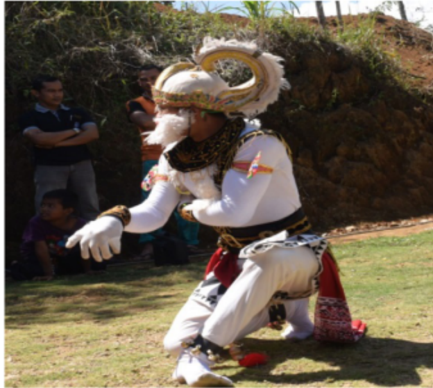
Gambar 75. Gerakan Jengkeng dengan tangan di depan dada (Dokumentasi Pribadi)

Gambar 75 menggambarkan gerakan dengan posisi kaki jengkeng kiri kedua tangan di depan dada yang tangan kiri posisi menempel di dada bagian kiri telapak tangan menghadap dada lalu tangan kanan di depan dada lurus ke depan dengan sedikit ditebuk sikunya dan bentuknya “cekitingan” istilah dalam tari Jawa. Posisi badan tegak lurus “Ndegek” dalam istilah tari Jawa dan posisi kepala melihat lurus ke kanan depan.