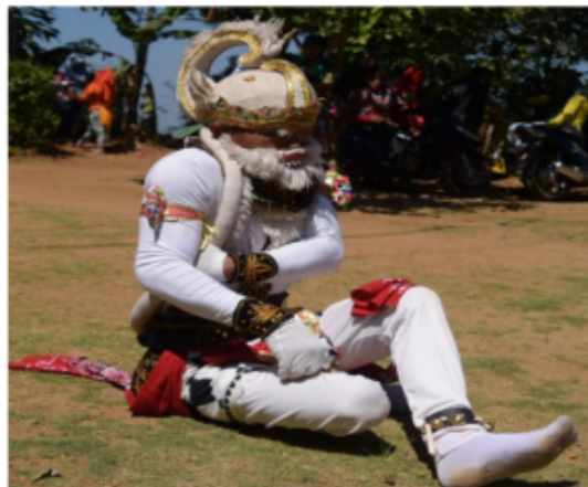
Gambar 32. Gerakan Jengkeng Kanan dan Ndegek dikombinasi tangan di depan dan salah satu di atas paha

Posisi kaki jengkeng kanan akan tetapi pantat menempel di tanah kedua tangan di depan dada yang tangan kiri posisi di atas paha kiri dengan bentuk jari menggenggam telapak tangan menghadap ke paha, kemudian yang tangan kanan di belakang tangan kiri dengan memegang dada bagian kiri. Posisi badan tegak lurus "Ndegek" dalam istilah tari Jawa dan posisi kepala melihat lurus ke depan