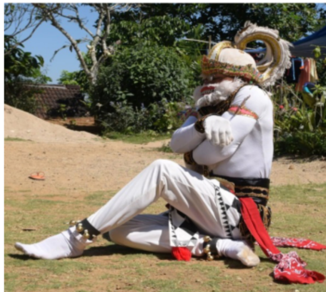
Gambar 51. Gerakan Jengkeng dan ndegek serta tangan di depan dad

Posisi kaki jengkeng kiri akan tetapi pantat menempel di tanah. kedua tangan di depan dada yang tangan kiri posisi menempel di dada bagian kanan dengan bentuk jari membuka telapak tangan menghadap ke dada dengan gerak menggaruk-garuk dada, kemudian yang tangan kanan di atas tangan kiri bentuk jari mencakar telapak tangan menghadap ke bawah. Posisi badan tegak lurus "Ndegek" dalam istilah tari Jawa dan posisi kepala melihat lurus ke depan.