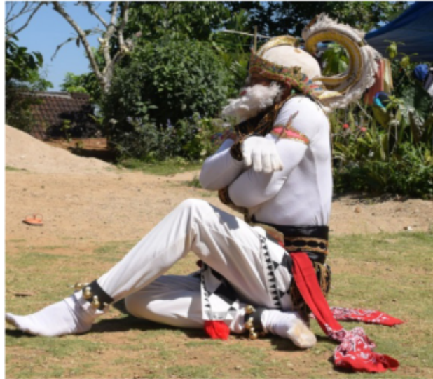
Gambar 50. Gerakan Jengkeng dan tangan menyilang di depan dada dengan siap menyakar

Gambar 50 di atas gerakan tari kethek Ogleng dengan posisi kaki jengkeng kiri akan tetapi pantat menempel di tanah. kedua tangan di depan dada yang tangan kiri posisi menempel di dada bagian kanan dengan bentuk jari membuka telapak tangan menghadap ke dada dengan gerak menggaruk-garuk dada, kemudian yang tangan kanan di atas tangan kiri bentuk jari mencakar telapak tangan menghadap ke bawah. Posisi badan tegak lurus “Ndegek” dalam istilah tari Jawa dan posisi kepala melihat lurus ke depan.