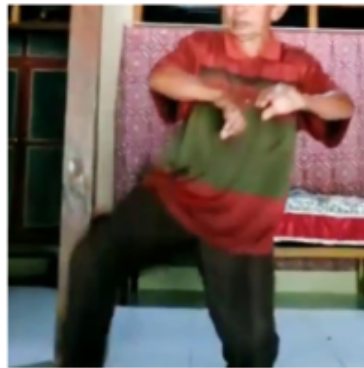
Gambar 10. Gerakan Kesepuluh Blendrong dalam Ketek Ogleng