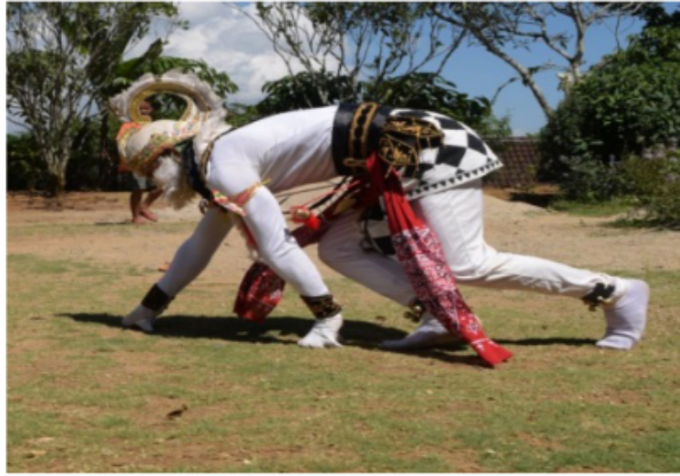
Gambar 64. Gerakan merangkak ala Kera (Dokumentasi Pribadi)

Gerak jalan merangkak kera yaitu sebuah gerak imitatif menirukan gerak kera dengan posisi membungkuk dan berjalan merangkak menggunakan 2 kaki dan 2 tangan. Posisi kepala menunduk melihat jalan yang dilewatinya.