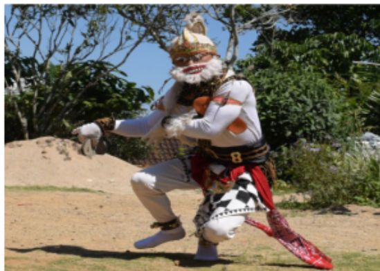
Gambar 22. Gerakan Kethek Ogleng Lari untuk Membawa Hasil dari Perjuangan Hidupnya.