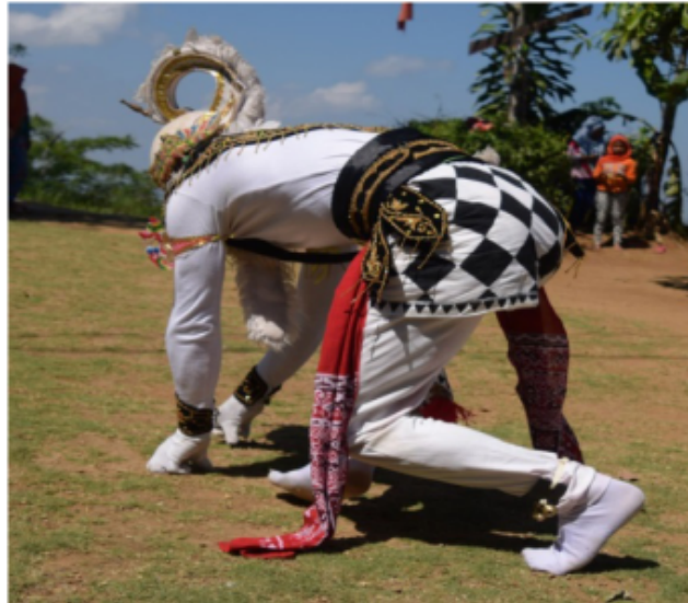
Gambar 33. Gerakan merangkak (Dokumentasi Pribadi)

Posisi tubuh merangkak dengan kaki kanan lurus, kaki kiri tekuk sedangkan tangan menggenggam menempel ke tanah pada bagian kepala menunduk mengikuti arah tubuh.