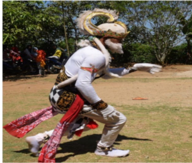
Gambar 72. Gerakan berjalan ala Kera

Gambar 72 denan gerakan jalan kera dengan posisi tubuh berdiri akan tetapi gerak ini menggunakan teknik kedua kaki ditebuk layaknya kera yang berjalan dan menggunakan istilah “Ulo nglangi” dalam istilah tari Jawa atau dalam bahasa Indonesia ular berenang yaitu gerakan pi 5 kan kaki serong ke kanan dan kiri dilakukan terus menerus. Posisi kedua tangan 5 di depan dada menyilang dan membentuk jari yang mencakar posisi tangan kanan kanan di atas tangan kiri. Posisi kepala mengikuti arah jalan yang ditentukan akan tetapi dalam gerak ini sudah ada motivasi atau tujuan yang dituju seperti mau berhenti atau melihat sesuatu dan mau memegang atau merampas atau mencakar dan lain sebagainya