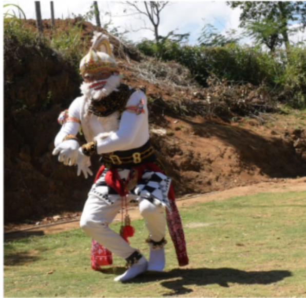
Gambar 74. Gerakan meloncat ala Kera

Gambar 74 di atas merupakan sebuah gerakan imitatif kera dengan teknik kaki meloncat ke kanan ke kiri dengan posisi tubuh berdiri. Posisi tangan bisa mengeksplorasi gerak menggaruk atau sedang memandang atau mencakar dan lain sebagainya. Posisi kepala sesuai yang diinginkan penari kethek ogleng