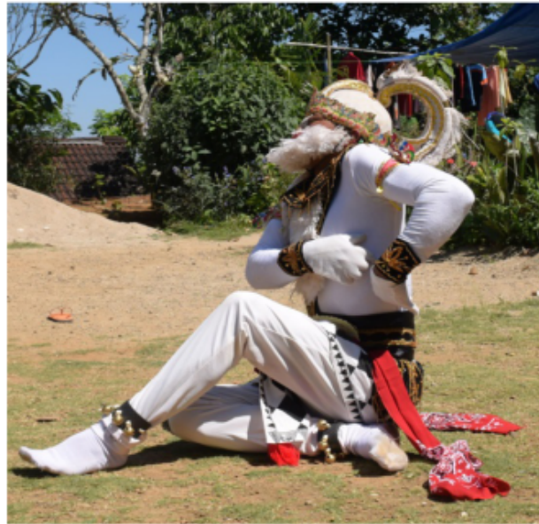
Gambar 54. Gerakan Jengkeng dengan pantat menempel tanah, Ndegek menggaruk sisi badan

Posisi kaki jengkeng kiri akan tetapi pantat menempel di tanah. kedua tangan di depan dada yang tangan kiri posisi menempel di dada bagian kiri dengan bentuk jari membuka telapak tangan menghadap ke dada dengan gerak menggaruk-garuk dada kiri, kemudian yang tangan kanan di atas tangan kiri bentuk jari mencakar telapak tangan menghadap ke dada kiri dengan gerak menggaruk-garuk dada juga. Posisi badan tegak lurus “Ndegek” dalam istilah tari Jawa dan posisi kepala melihat lurus ke depan agak menunduk.