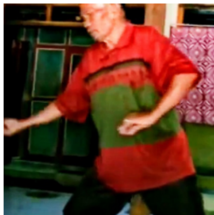
Gambar 6. Gerakan Keenam Blendrong dalam Kethek Ogleng

Gerakan berjalan dengan kaki kanan di depan dengan ibu jari dengan jari tengah membentuk gerakan yang luwes.