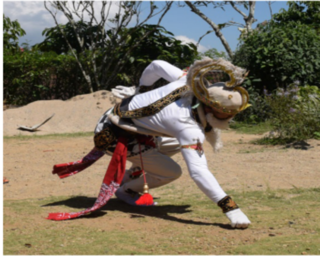
Gambar 56. Gerakan jalan seperti kera nyemper dengan tumpuan kedua kaki dan tubuh condong ke kiri (Dokumentasi Pribadi)

Gerak jalan kera ke samping kanan dengan lontaran kedua kaki ke kiri kemudian menggunakan tumpuan tangan kanan yang menggenggam ke tanah dan tangan kiri ditekek dengan bentuk jari mencakar di sebelah kiri badan bagian kiri belakang. Badan posisi membungkuk dan posisi kepala melihat lurus ke samping kiri depan.