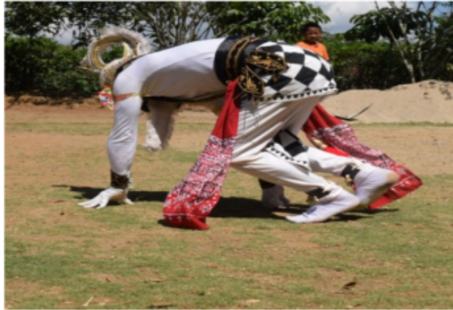
Gambar 65 .Gerakan awal jungkir atau roll

Berdasarkan gambar 65 di atas, gerak ini mengisyaratkan akan melakukan gerak Rol depan yang sudah dijelaskan di deskripsi di atas. Gerakan berputar seluruh tubuh 360 derajat ke depan. Dan di akhir posisi jengkeng pose kera.