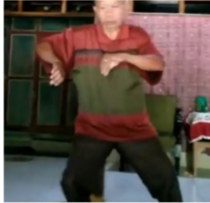
Gambar 9. Gerakan Kesembilan Blendrong dalam Ketek Ogleng

Telapak tangan yang menghadap ke luar yang merupakan tiruan gerakan tangan kera. Kaki kanan di depan dan kaki kiri di belakang.