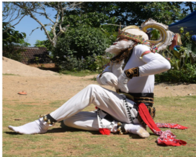
Gambar 53. Gerakan Jengkeng dan Ndegek dengan kombinasi gerakan menggaruk

Posisi kaki jengkeng kiri akan tetapi pantat menempel di tanah. kedua tangan di depan dada yang tangan kiri posisi menempel di dada bagian kiri dengan bentuk jari membuka telapak tangan menghadap ke dada dengan gerak menggaruk-garuk dada kiri, kemudian yang tangan kanan di atas tangan kiri bentuk jari mencakar telapak tangan menghadap ke dada kiri dengan gerak menggaruk-garuk dada juga. Posisi badan tegak lurus “Ndegek” dalam istilah tari Jawa dan posisi kepala melihat lurus ke depan agak mendongak ke atas