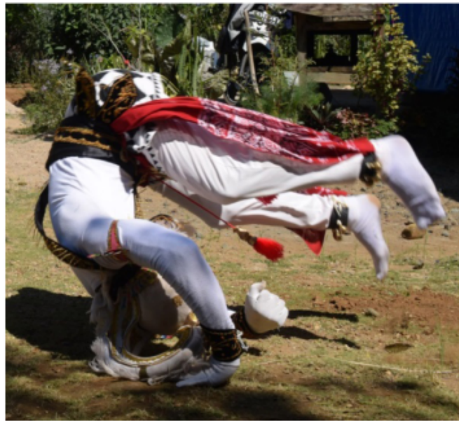
Gambar 37. Gerakan roll depan

Gerak akrobatik roll depan dengan posisi tubuh melingkar dengan tumpuan kedua tangan yang menempel di tanah diberikan lontaran dengan kaki untuk maju ke depan kemudian bergerak berputar 360 derajat.