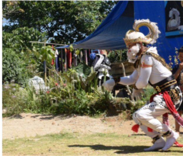
Gambar 76. Gerakan berjalan sembari berdiri ala Kera (Dokumentasi Pribadi)

Gambar 76 di atas, dengan gerakan jalan kera dengan posisi tubuh berdiri akan tetapi gerak ini menggunakan teknik kedua kaki ditebuk layaknya kera yang berjalan dan menggunakan istilah “Ulo nglangi” dalam istilah tari Jawa atau dalam bahasa Indonesia ular berenang yaitu gerakan pijakan kaki serong ke kanan dan kiri dilakukan terus menerus. Posisi kedua tangan di depan dada menyilang dan membentuk jari yang mencakar posisi tangan kanan kanan di atas tangan kiri. Posisi kepala mengikuti arah jalan yang ditentukan akan tetapi dalam gerak ini sudah ada motivasi atau tujuan yang di tuju seperti mau berhenti atau melihat sesuatu dan mau memegang atau merampas atau mencakar dan lain sebagainya.