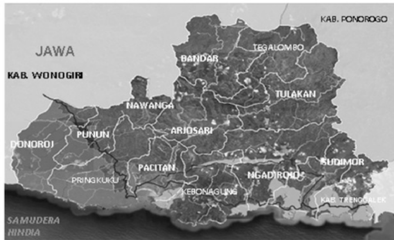
Gambar 2. Letak Kabupaten Pacitan

Kabupaten Pacitan berbatasan dengan wilayah-wilayah seperti terlihat pada gambar II. Adapun batas-batas administratif wilayah Kabupaten Pacitan adalah sebagai berikut: sebelah selatan berbatasan Samudera Indonesia, sebelah barat berbatasan Kabupaten Wonogiri (Jawa Tengah), sebelah utara berbatasan Kabupaten Ponorogo (Jawa Timur), dan sebelah timur berbatasan Kabupaten Trenggalek (Jawa Timur). 42