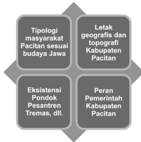
Gambar 4. Penyebab Keberagaman Tersemai di Kabupaten Pacitan

kepesantrenan cukup strategis dalam menjaga kedamaian, dan peradaban kota yang dikenal sebagai Kota Seribu Satu Gua ini. Jadi, masa depan keberagaman di Kabupaten Pacitan tetap terjaga. Dengan demikian, Pacitan tetap menjadi hunian yang nyaman bagi kehidupan manusia.