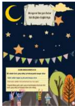
Gambar 1.7 Bagian-Bagian Bangun Datar