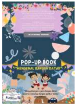
Gambar 1.1 Sampul media pop-up book

untuk meningkatkan pemahaman siswa kelas II sekolah dasar. Berikut tampilan yang telah dibuat: