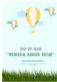
Gambar 1.2 Halaman Depan