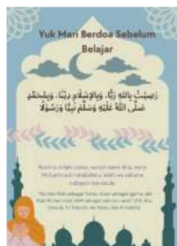
Gambar 1.5 Doa Sebelum Belajar