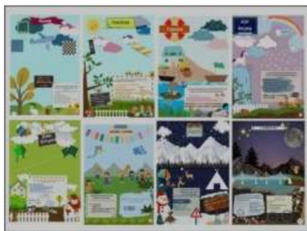
Gambar 1.9 Materi Bangun Datar