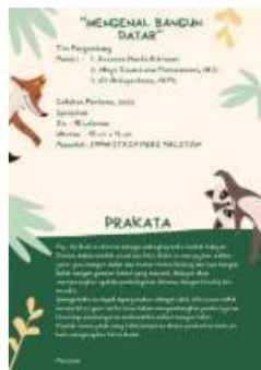
Gambar 1.3 Identitas penulis