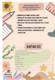
Gambar 1.4 Cara Penggunaan dan Daftar Isi