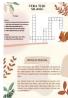
Gambar 1.10 Teka-Teki dan Biodata Penulis