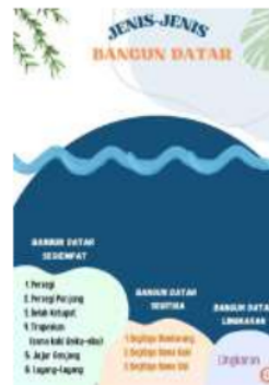
Gambar 1.8 Jenis-Jenis Bangun Datar