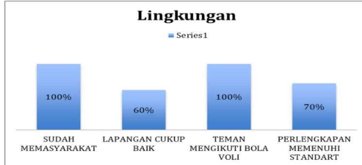
Diagram 3 Aspek Lingkungan

Aspek lingkungan merupakan aspek eksternal yang berpengaruh terhadap minat seseorang dalam berlatih. Pada penelitian ini aspek lingkungan yang diteliti meliputi aspek permainan bola voli sudah memasyarakat yaitu sebesar 100% dalam kategori sangat tinggi, kondisi lapangan yang cukup baik sebesar 60% dengan kategori sedang, minat berlatih sebab banyak teman mengikuti latihan bola voli sebesar 100% dengan kategori sangat tinggi, aspek perlengkapan memenuhi standart sebesar 70% dalam kategori tinggi. Pada aspek lingkungan minat berlatih anggota Karang Taruna Tunas Harapan Desa Ngreco Kecamatan Tegalombo dalam kategori tinggi yaitu sebesar 83%.